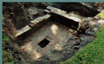
In 2010 zijn proefsleuven gegraven op het kloosterterrein, waarbij informatie is verkregen over de locatie van verschillende gebouwen. In het bijzonder is de locatie van de kerk interessant.